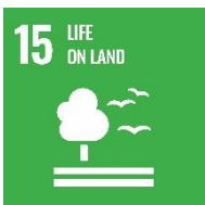
SFI 15 – Beatha ar talamh.