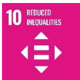
SFI10 – Neamhionannais Laghdaithe.

Ní bhaineann sé seo dár dtiomantas ná dár ngníomhartha maidir le Comhionannas agus Míchumas. Léiríonn sé rannóga ag obair le chéile chun torthaí dearfacha a bhaint amach.