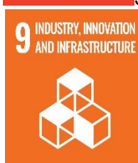
SFI9 Nuálaíocht agus Bonneagar Tionscail