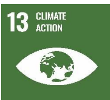
SFI13 Gníomhaíocht Aeráide)