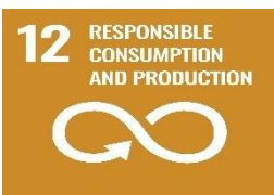
SFI12 Táirgeadh agus Tomhaltas Freagrach