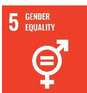
SFI5 Comhionannas Inscne