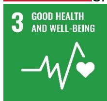
SFI3 – Dea-shláinte agus folláine